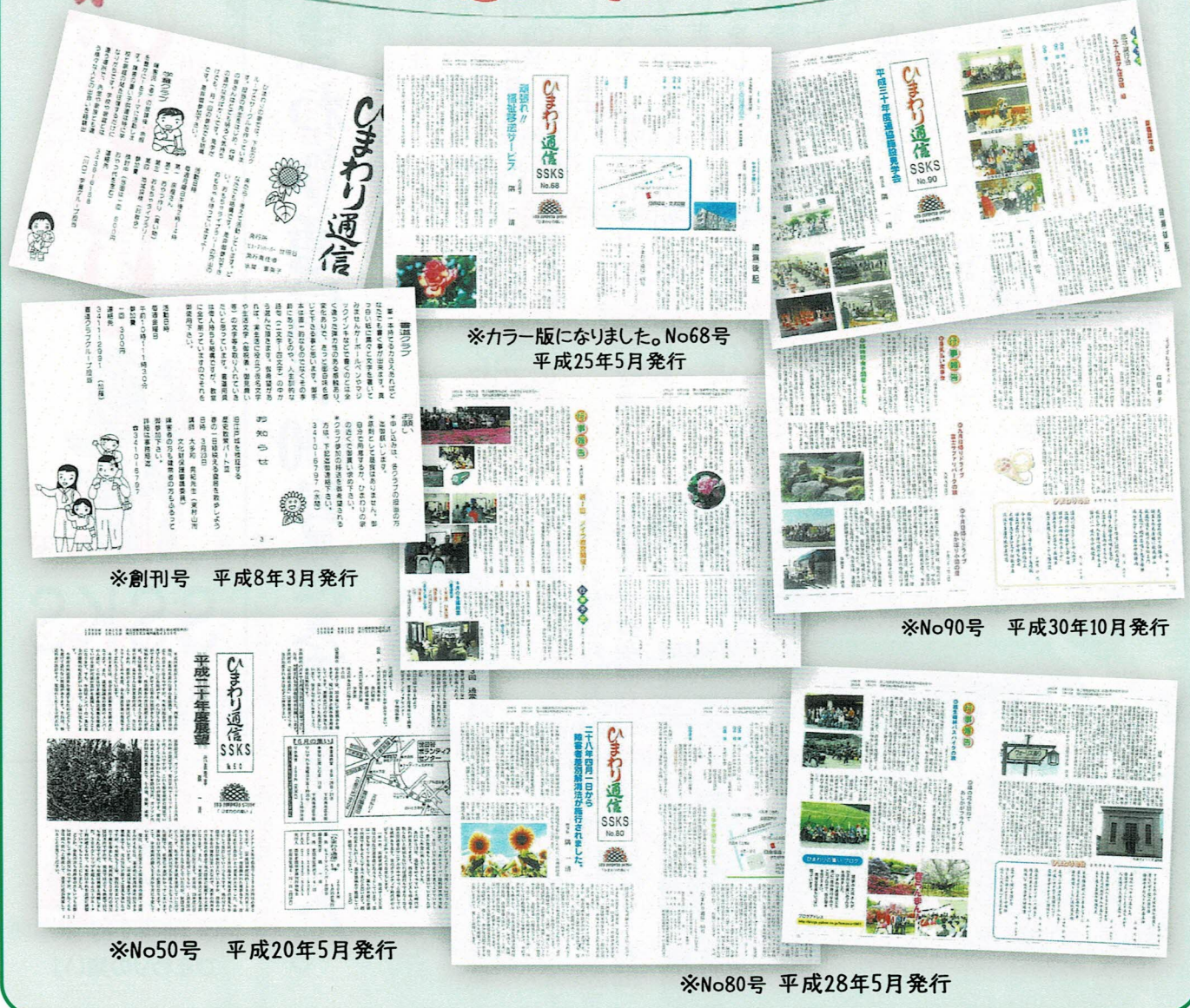
※カラー版になりました。No68号 平成25年5月発行