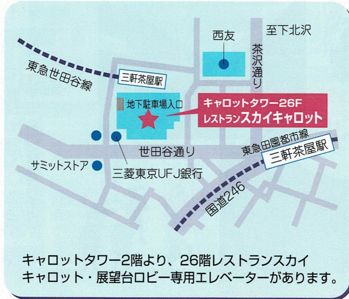
キャロットタワー2階より、26階レストランスカイキャロット・展望台ロビー専用エレベーターがあります。