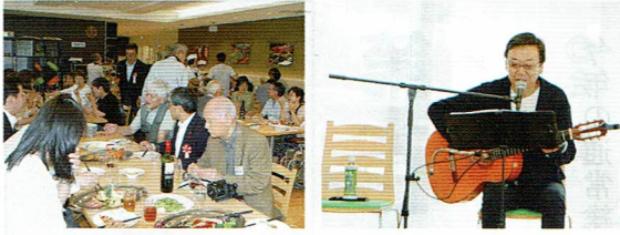
～第11回懇親会会場風景～

最近では長野県軽井沢に事務所を開き、北海道や、自由が丘でも一ヶ月に一回程のライブを開いています。ぜひお出かけ下さい。